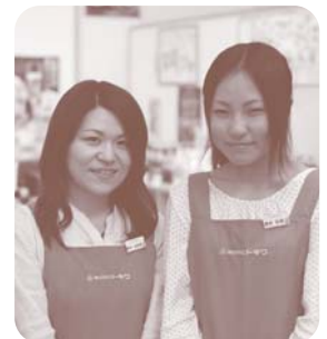
美人スタッフがお待ちしております。何でもお気軽にお尋ね下さい。