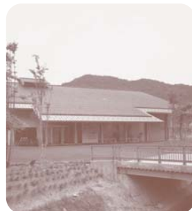
矢田川温泉の隣のトキワ社屋です。

小さい頃から見ているこの山陰海岸が世界ジオパークに認定され本当に嬉しく思います。この素晴らしい海岸を守るため私にできること、自然に感謝し、小さいことですが、海岸にゴミが落ちていけば拾ったりまた皆様に広めていくことがなと思います。皆様も山陰海岸に足を運んでみてはいかがでしょうか。知れば知るほど自然の力が素晴らしいなと思います。