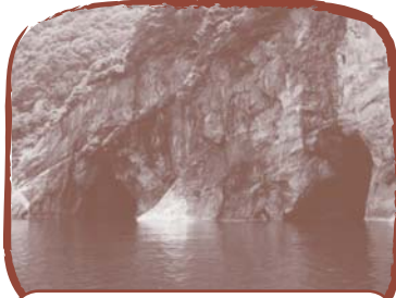
釣鐘洞門(つりがねどうもん)

今年(2010年)10月に世界ジオパークネットワークの最終審査がギリシャであり、山陰海岸ジオパーク(兵庫県・京都府・鳥取県)が世界ジオパークに認定されました。