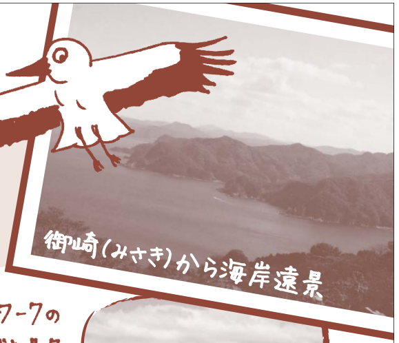
御崎(みさき)から海岸遠景

国内では2009年に登録された洞爺湖有珠山(北海道)・糸魚川(新潟県)・島原半島(長崎県)に続いて4地域目です。