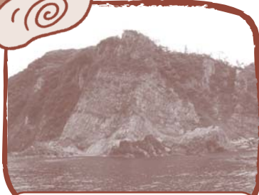
鎧の袖(よろいのそで)