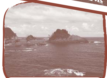
但馬松島(たじままつしま)