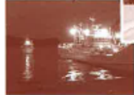
雲がー晩 降りつづくと 外は一面、白銀の世界。