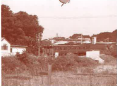
のんびりとした 田舎の風景にピッタリ。 二両のワンマン電車