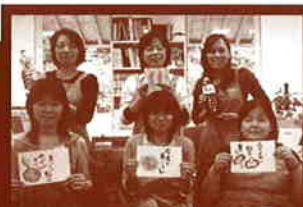
オペレーター6人娘です。 お電話お待ちしております。

えーだしは素材を活かす黄金比率のえだし。 魚貝類は、もちろんのこと、野菜もおしく食べられるのが えだしのええところ。 年末年始はつつき食べ過ぎてお腹も「ツカレ」てなりがち。 よかあさの味、やさしい味のえだし。次の時こそ、 野菜をたっぷり食べて、体をいたわりた〜いものですね。